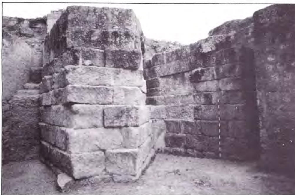
LÁMINA VI. Detalle de uno de los contrafuertes situados delante de la fachada principal del templo.

Llaman la atención estas cifras, en primer lugar, por su proximidad con las dimensiones de la Maison Carrée de Nîmes, 31'81 por 15'01 m. 13 , así como por la imponente masa constituida por los cimientos con más de siete metros de profundidad, que pone de manifiesto el alcance de las obras de infraestructura previas a la edificación del propio templo y justificadas, según todos los indicios, por el deseo de crear un entorno monumental de singular categoría 14 .